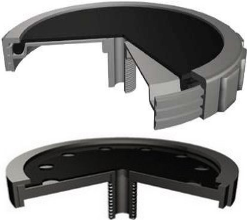
FlexAir Threaded Disc